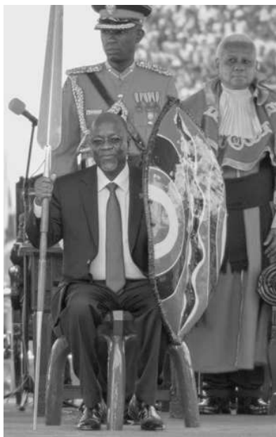
Новый президент Танзании Джон Магуфули. 2015 г.